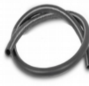
1 tubo di connessione FAP