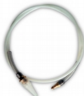
1 sonda a spruzzo conica.