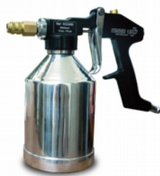
1 pistola a spruzzo 12 bar (175 psi) con un serbatoio da 800 ml.

PISTOLA E SONDE CONSENTONO UNA PRESSIONE DI PULIZIA FINO A 12 BAR!