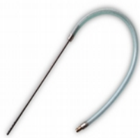
1 sonda a spruzzo a 4 fori.